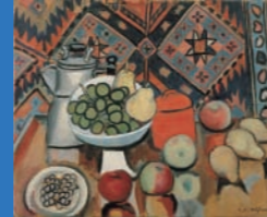
児島善三郎【静物】1949年油彩・画布