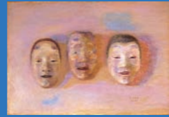
坂本繁二郎【熊面】1955年油彩・画布