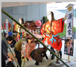
大人形 400年の歴史ある 筑後の奇祭